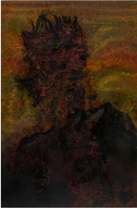
الأمير، 1994 ألوان زيتية و خيش على قماش 61 × 91 سم The Prince , 1994 Oil and burlap on canvas 91 x 61 cm