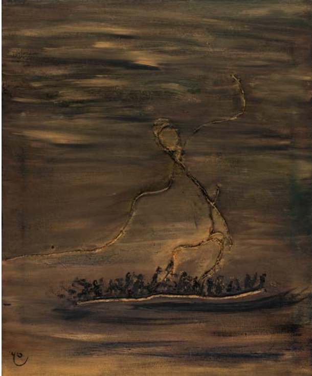
سفينة نوح ، 1995 ألوان زيتية و خيش على قماش 51 x 61 سم Noah's Arc , 1995 Oil and burlap on canvas 61 x 51 cm