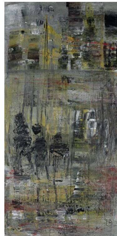
مدينة طافية، 2023 أكريليك على قماش 30 x 60.2 سم Floating City 2, 2023 Acrylic on canvas 60.2 x 30 cm