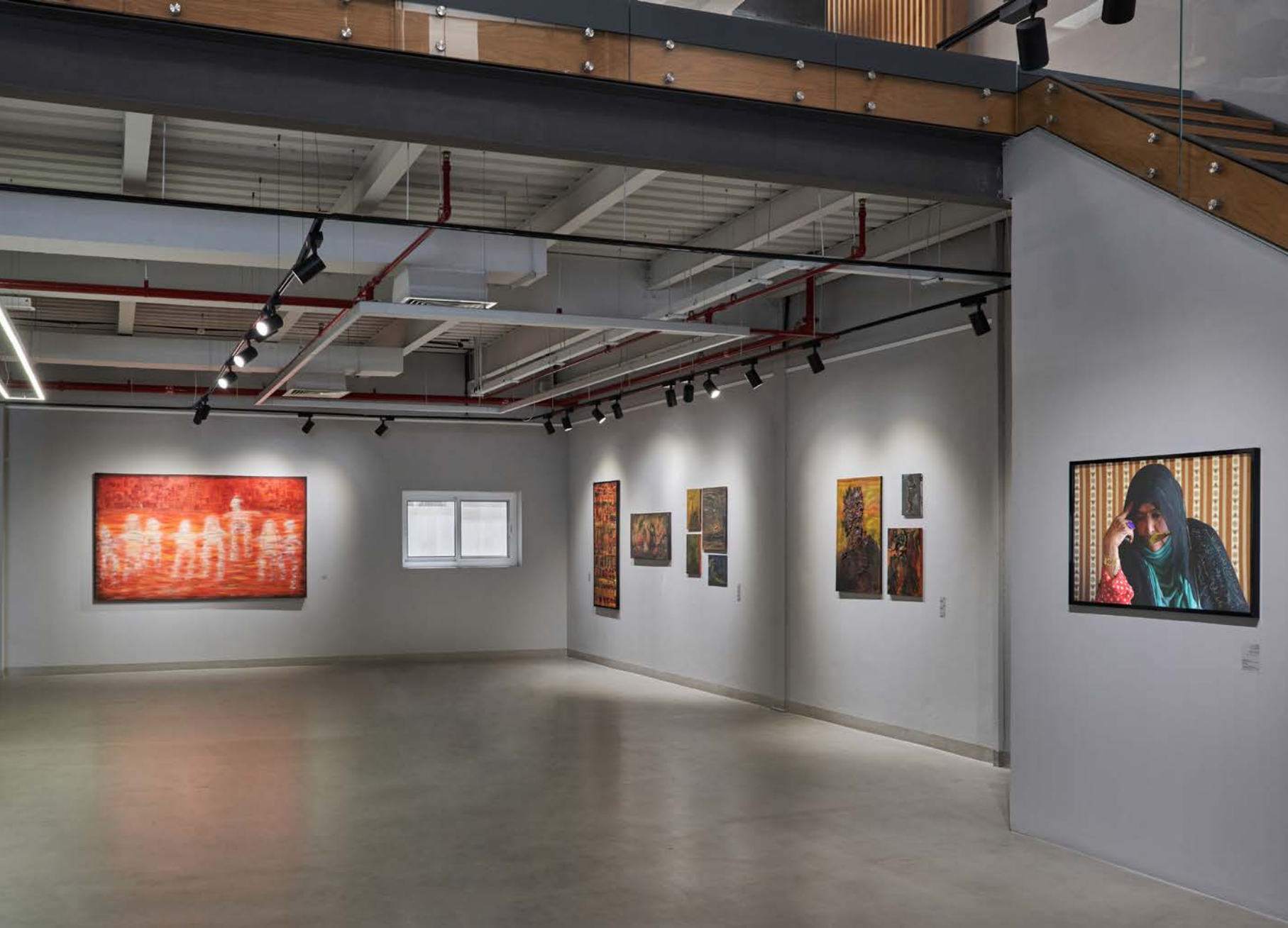
Installation view, Unframed , Aisha Alabbar Gallery, 2023