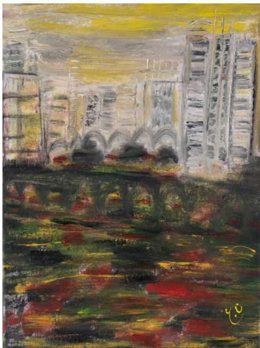
نسخ اليوم الممطر، 2023 أكريليك على قماش 30.5 x 40.7 سم Copying the Rainy day, 2023 Acrylic on canvas 40.7 x 30.5 cm