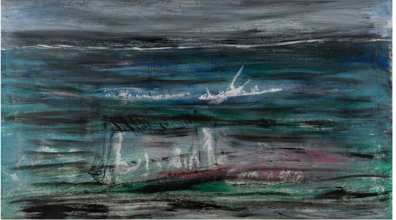
صبيادون، 2005 ألوان زيتية ووسائط متعددة على قماش 145 x 80 سم Fishermen , 2005 Oil and mixed media on canvas 80 x 145 cm