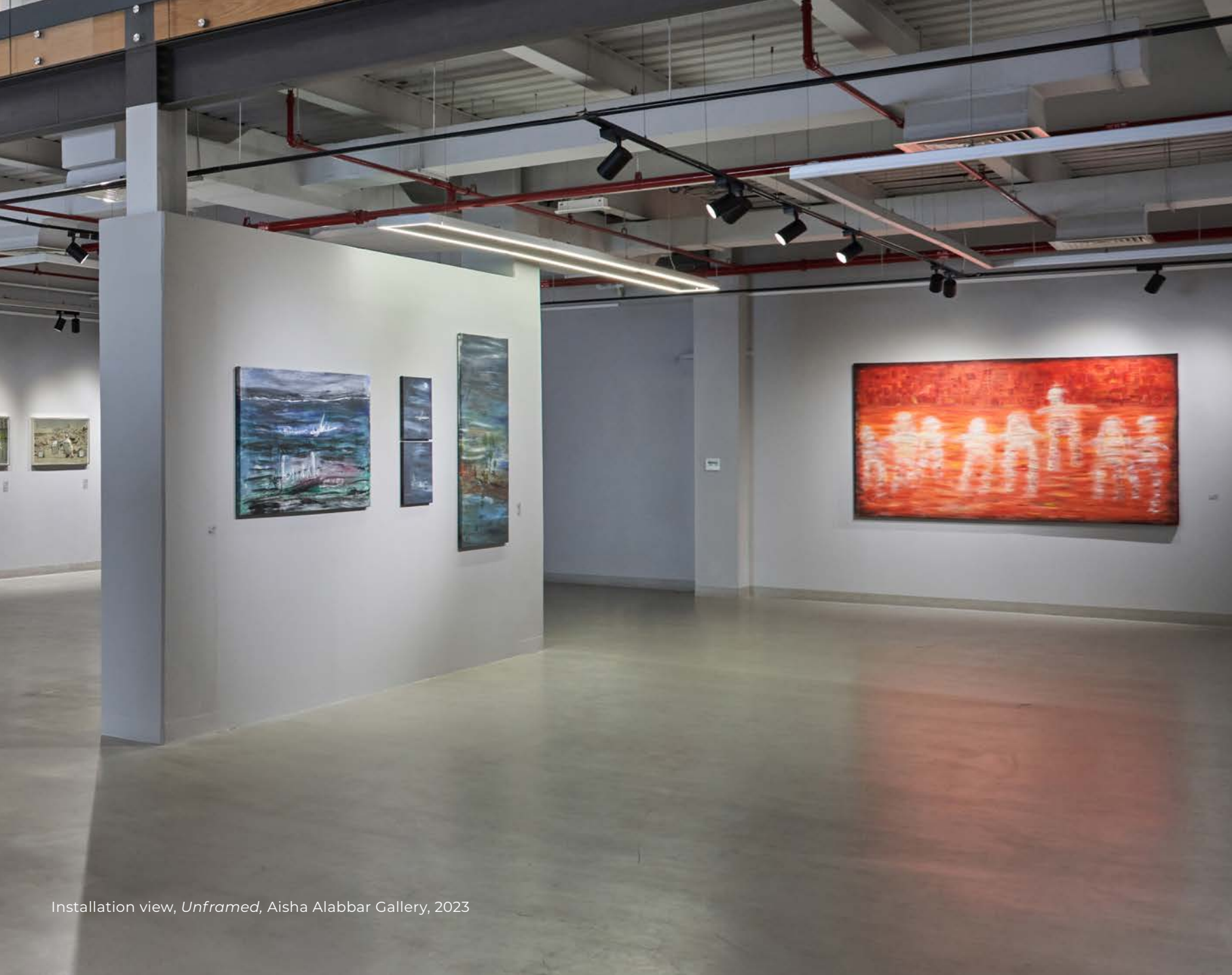
Installation view, Unframed , Aisha Alabbar Gallery, 2023