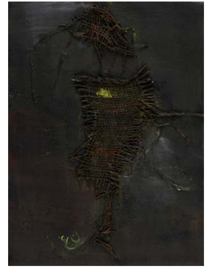
رجل من المريخ، 1995 ألوان زيتية ووسائط متعددة على قماش 22.8 × 30.7 سم A Man from Mars , 1995 Oil and mixed media on canvas 30.7 x 22.8 cm