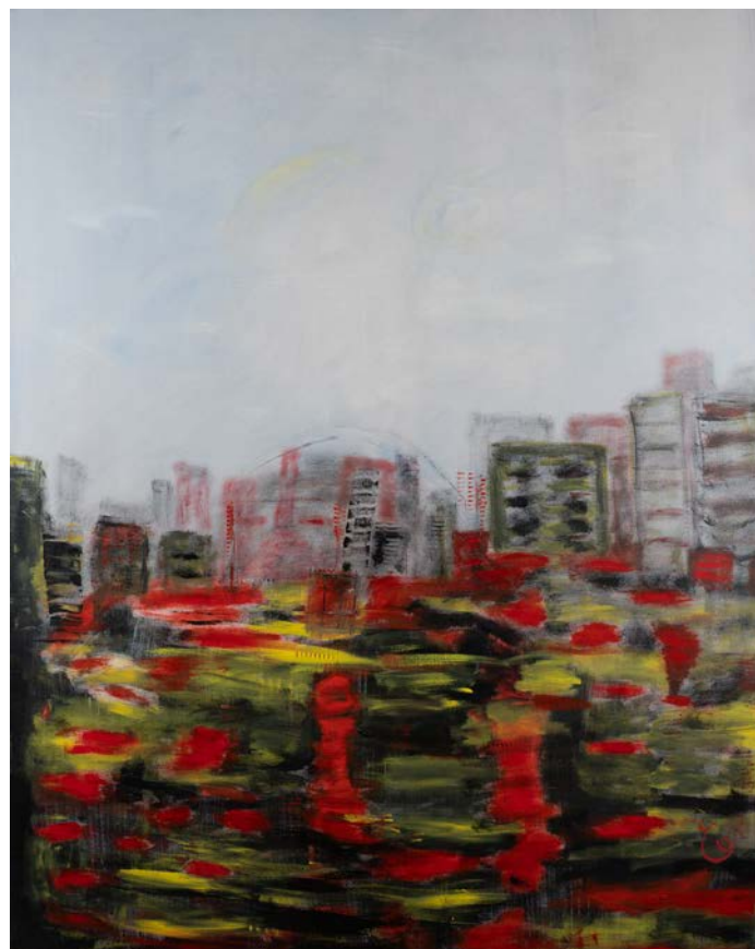
المدينة تحت المطر 2 ، 2023 أكريليك على قماش سم 121.5 x 152.5 The City in the Rain 2, 2023 Acrylic on canvas 152.5 x 121.5 cm