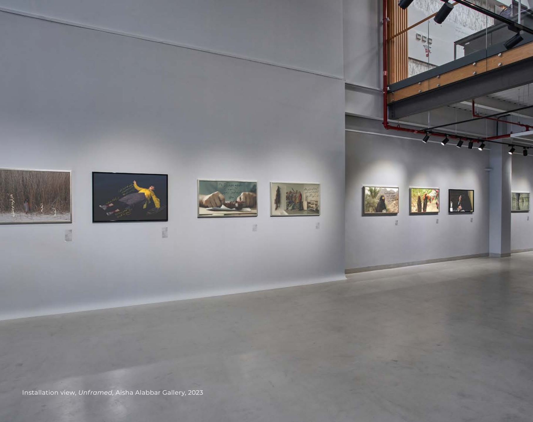
Installation view, Unframed , Aisha Alabbar Gallery, 2023