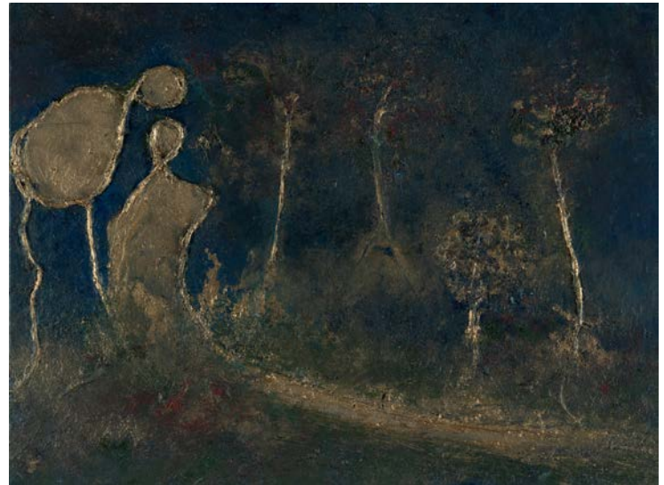
أرواح الحديقة، 2001-02 ألوان زيتية وخيش على خشب 40 x 30 سم The Spirits of the Garden , c. 2001-02 Oil and burlap on board 30 x 40 cm