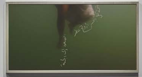
Installation view, Unframed , Aisha Alabbar Gallery, 2023