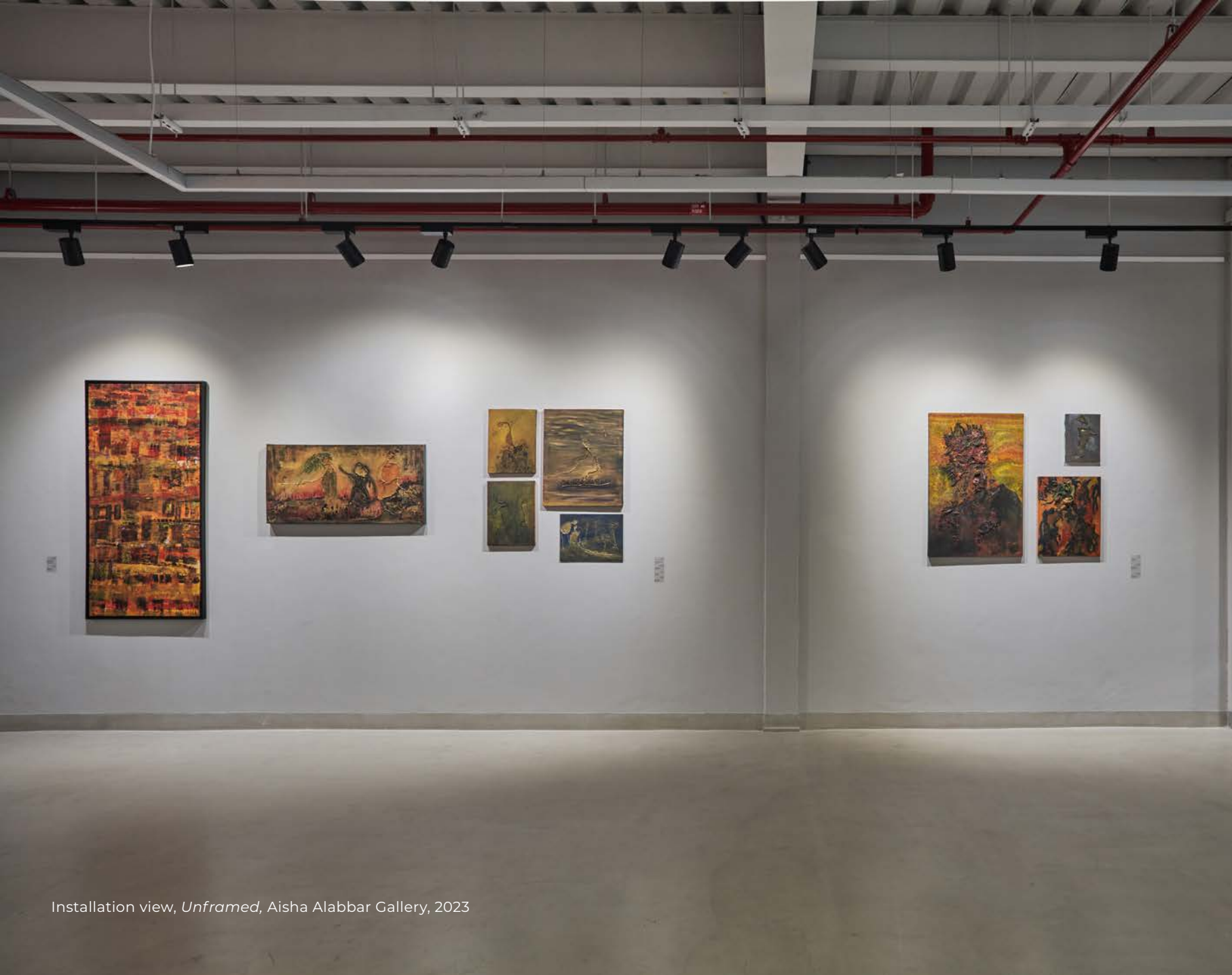
Installation view, Unframed , Aisha Alabbar Gallery, 2023