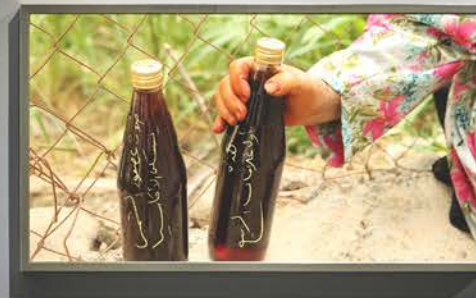
Small text label below the second artwork.