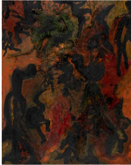
شعب المريخ ، 1995 ألوان زيتية ووسائط متعددة على قماش 30 × 40 سم Spirits of Mars , 1995 Oil and mixed media on canvas 40 x 30 cm