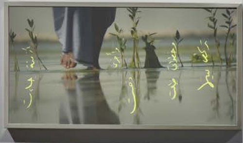
Small informational label below the first artwork.