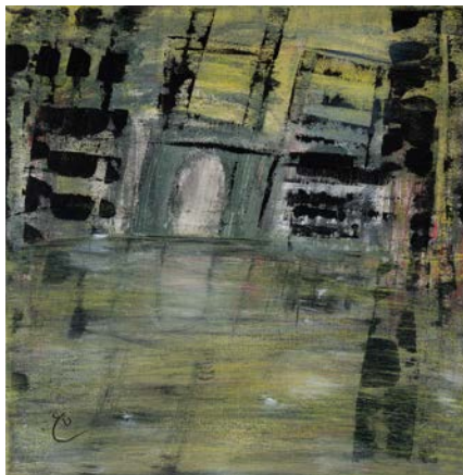
لقطة مقرّبة لحيّتها ، 2023 أكريليك على قماش 30 x 30 سم A Close-up of Her Neighborhood, 2023 Acrylic on canvas 30 x 30 cm