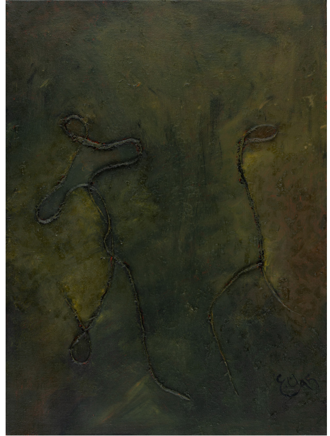
شعب المريخ ، 1995 ألوان زيتية ووسائط متعددة على قماش 30 x 40 سم People of Mars , 1995 Oil and mixed media on canvas 40 x 30 cm