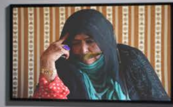
Installation view, Unframed , Aisha Alabbar Gallery, 2023