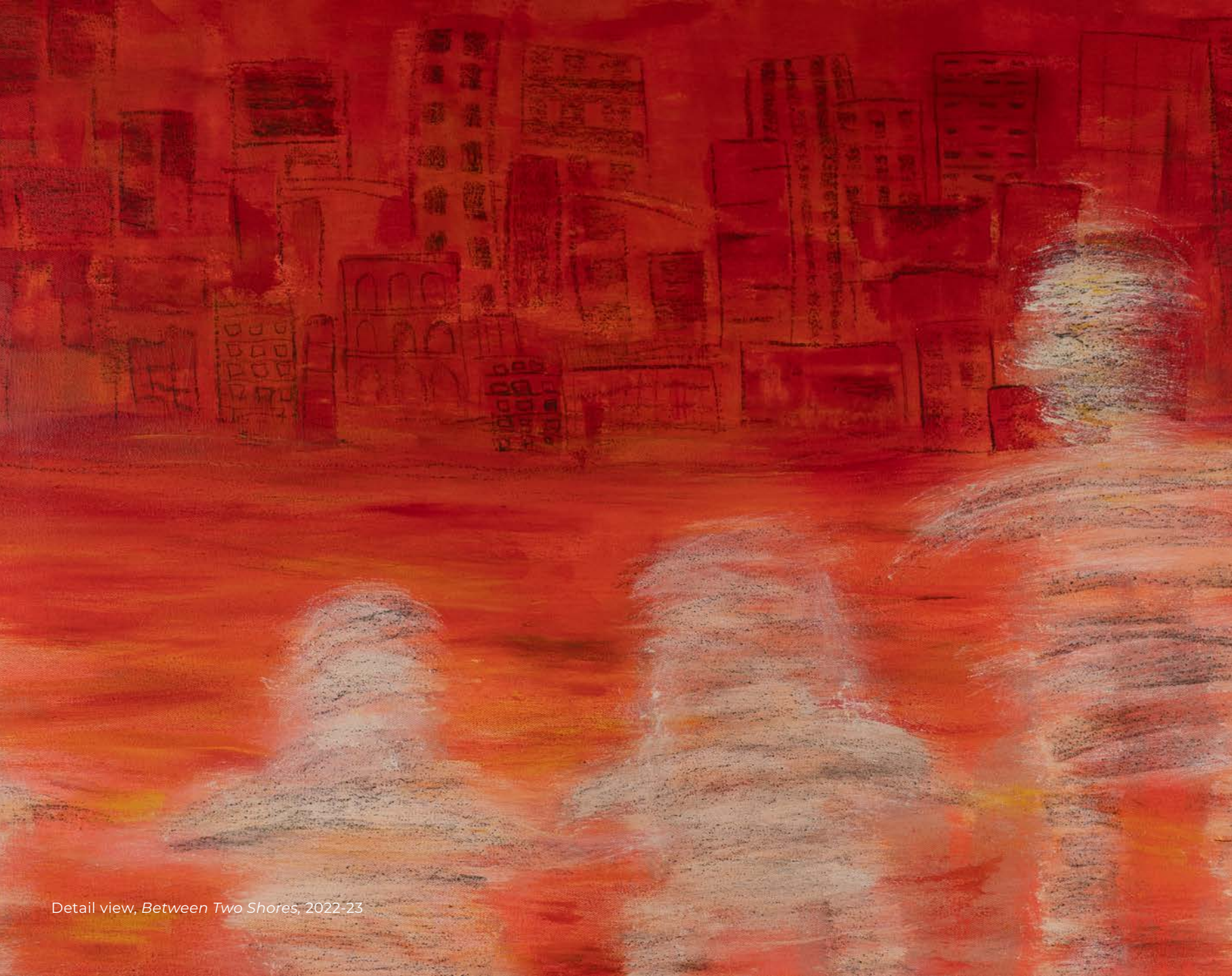
Detail view, Between Two Shores , 2022-23