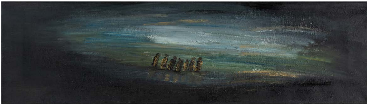
انتظار، 2003 ألوان زيتية ووسائط متعددة على قماش 70 x 20 سم In Waiting, 2003 Oil and mixed media on canvas 20 x 70 cm