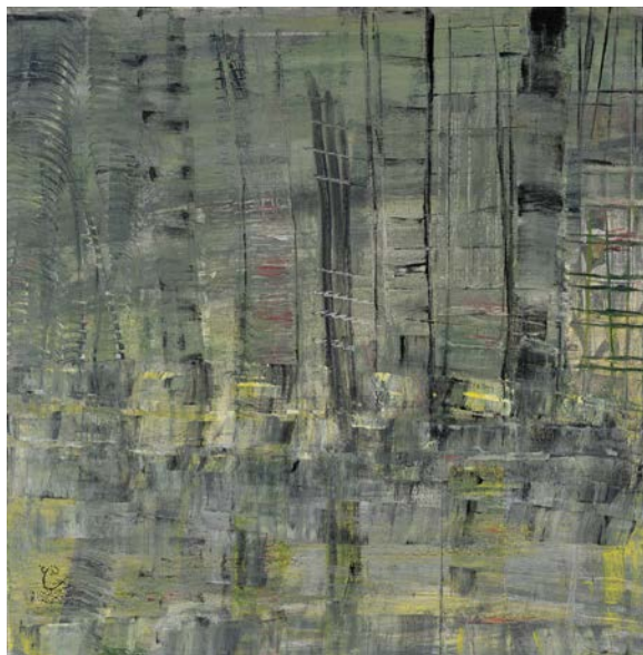
حيّتها، 2022 أكريليك على قماش 50 x 50 سم Her Neighbourhood, 2022 Acrylic on canvas 50 x 50 cm