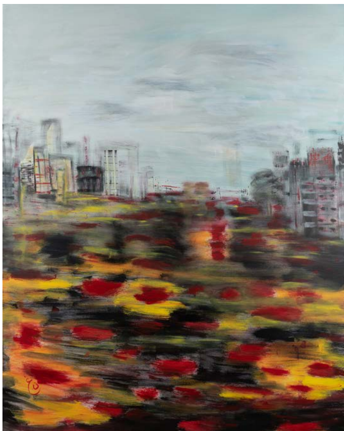
المدينة تحت المطر 1 ، 2023 أكريليك على قماش سم 121.5 x 152.5 The City in the Rain 1, 2023 Acrylic on canvas 152.5 x 121.5 cm