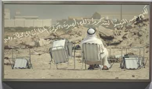
Small informational label below the second artwork.