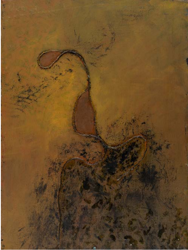
ممثلة ذلك المشهد، 1994 ألوان زيتية ووسائط متعددة على قماش 30 x 40 سم The Actress of that Scene , 1994 Oil and mixed media on canvas 40 x 30 cm