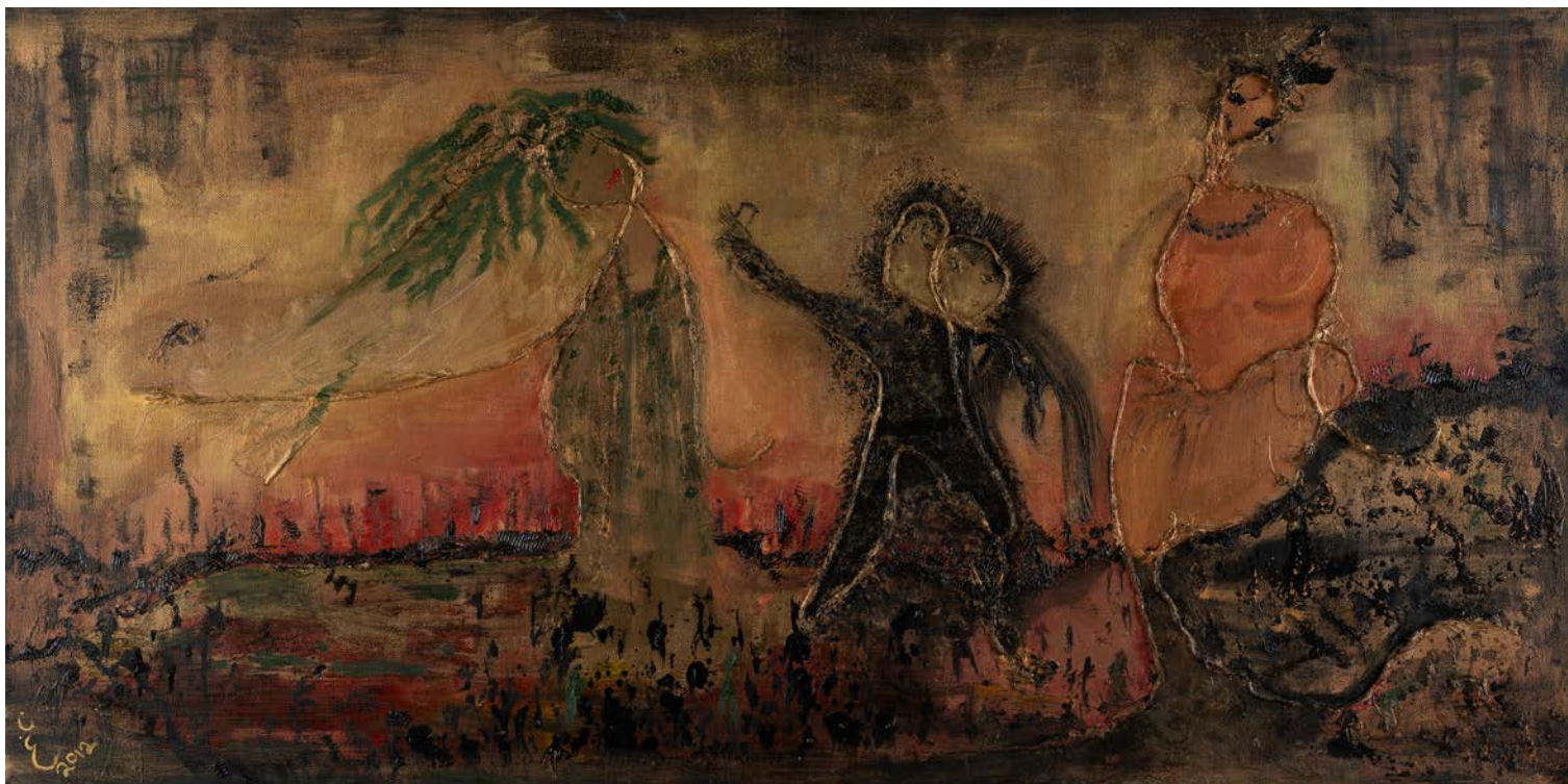
احتفال، 2012 وسائط متعددة على قماش 100 x 50 سم Celebration, 2012 Mixed media on canvas 50 x 100 cm