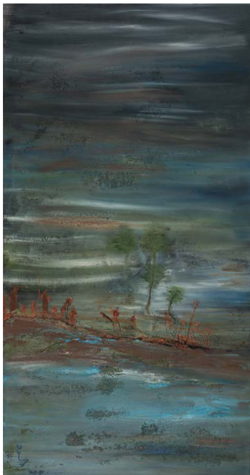
جنة مُتخيلة، 2007 ألوان زيتية ووسائط متعددة على قماش 75 × 145 سم

An Imaginary Eden , 2007 Oil and mixed media on canvas 145 x 75 cm