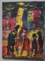
Installation view, Unframed , Aisha Alabbar Gallery, 2023