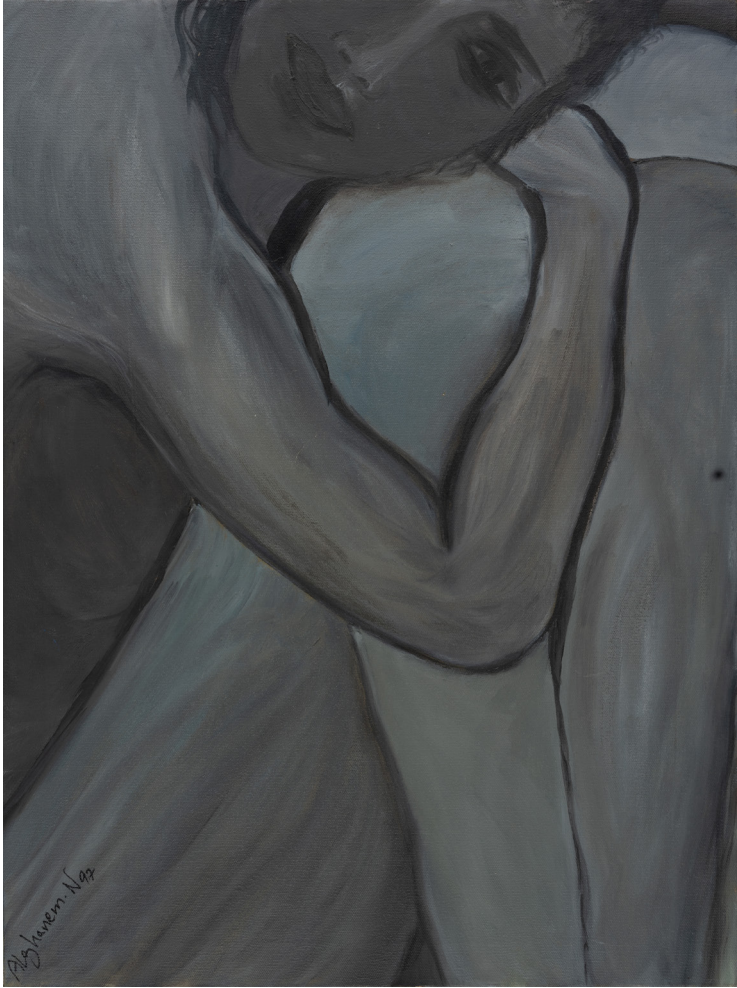
امراة, 1997 الوان زيتية على قماش 46 x 61 سم Woman, 1997 Oil on canvas 61 x 46 cm