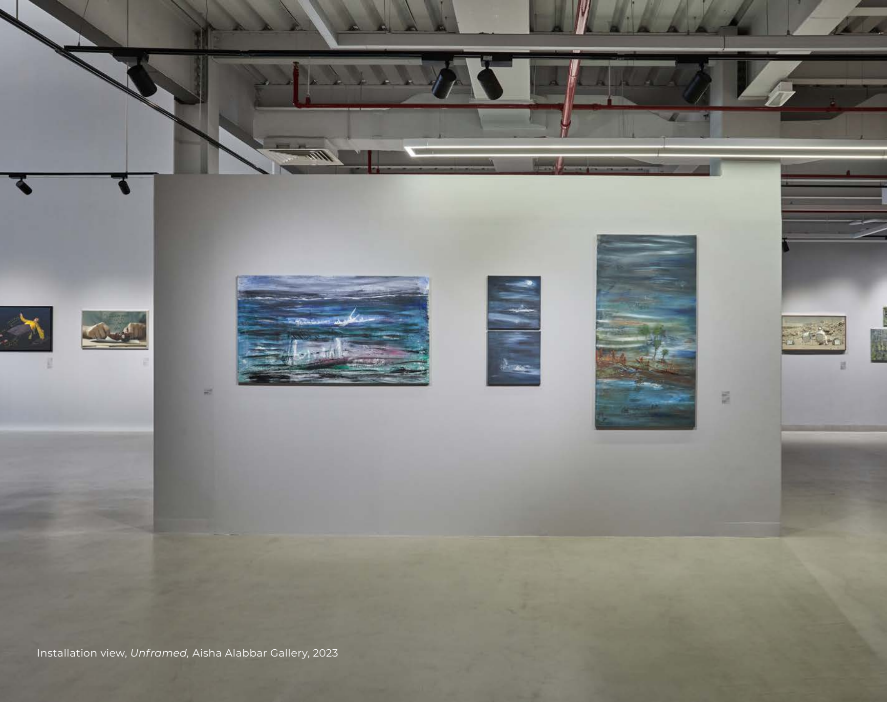
Installation view, Unframed , Aisha Alabbar Gallery, 2023