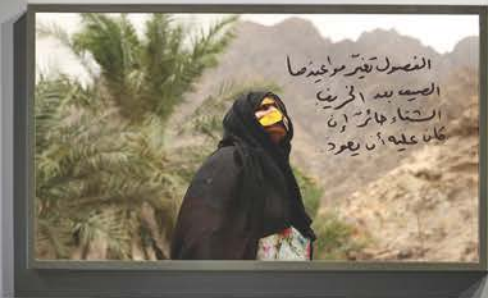
Small text label below the first artwork.