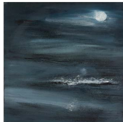
ضوء القمر، 2000 ألوان زيتية على قماش 80 × 40 سم ( 40 × 40 سم لكل منهما)

An Imaginary Eden , 2007 Oil and mixed media on canvas 145 x 75 cm